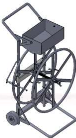
Рис. 1 Внешний вид диспенсера SP-83 для ПП

Настоящее руководство определяет комплект поставки диспенсера-размотчика (далее диспенсер), порядок сборки, указания по использованию и эксплуатации. Изделие может поставляться как в собранном виде так и россыпью. При получении диспенсера необходимо полностью проверить комплектность получаемых деталей.